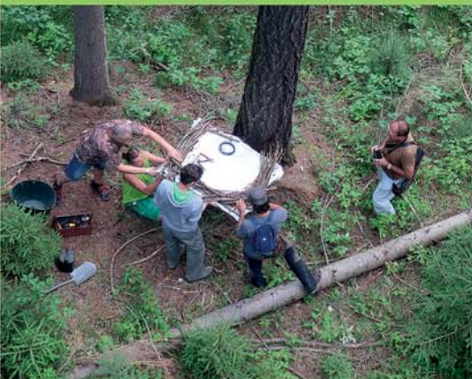
Akce nové hnízdo Slavíkov u Olomouce 7. 7. 2019