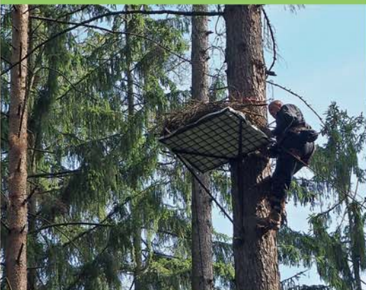
Nová hnízdní podložka Slavíkov u Olomouce 7. 7. 2019