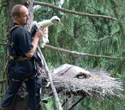
Čáp černý 61X0 kroužkovaný 15. 6. 2018 jako mládě na hnízdě u Chrančovic (PS).